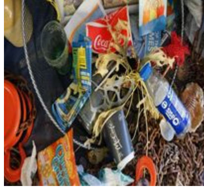
Desechos industriales y domésticos